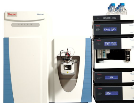
AVANCE III 600 MHz 全数字化超导核磁共振谱仪 Thermo Fisher Q Exactive 液质联用仪